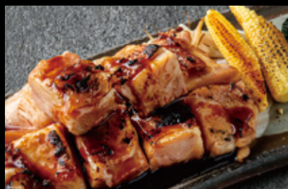
鶏もも肉鉄板焼 1,330円