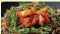
ねぎキムチのせ +450円