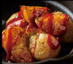
鉄板じゃがバター 600円