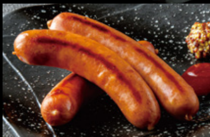
ソーセージ鉄板焼 (プレーン) 720円