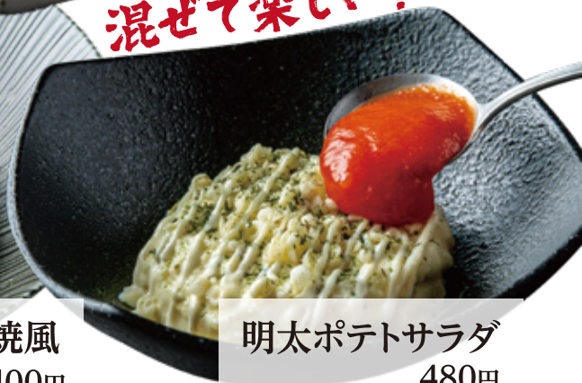
明太ポテトサラダ 480円