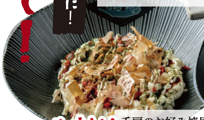
これも美味しい! 千房のお好み焼風 ポテトサラダ 400円