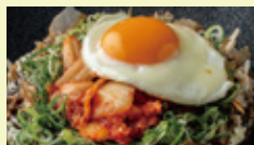
ねぎ玉キムチのせ +600円