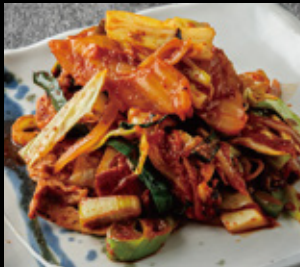
豚キムチ鉄板焼 700円