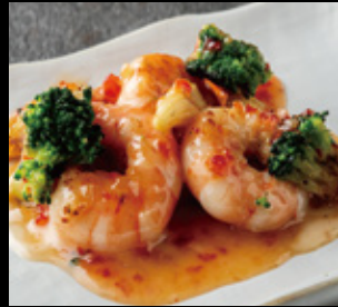
特製海老マヨ鉄板焼 1,080円