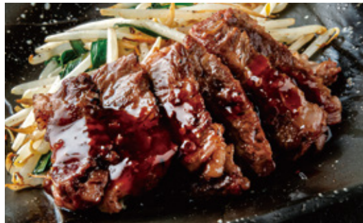
牛ハラミ鉄板焼 1,530円