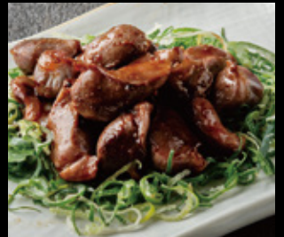
砂ずりの鉄板焼 600円