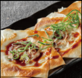
パリパリ鉄板餃子 (4枚) 640円