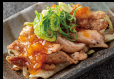
鶏せせりと九条葱の 鉄板焼 740円