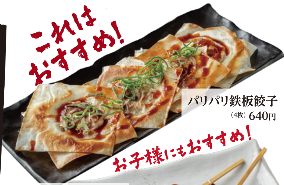
パリパリ鉄板餃子 (4枚) 640円