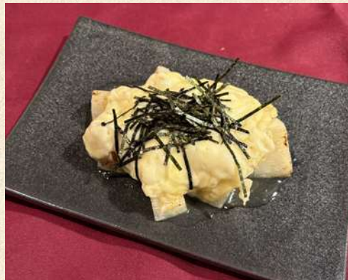
山芋チーズステーキ 580円