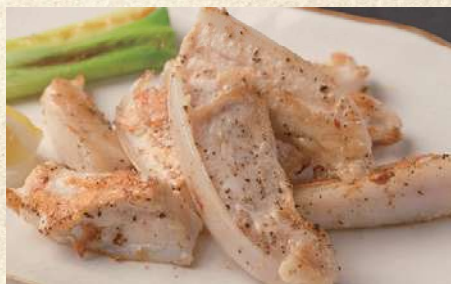
やげん軟骨鉄板焼 680円