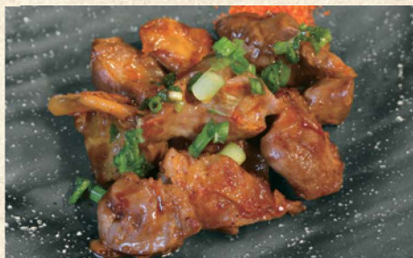
砂ずりの鉄板焼 540円