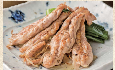
せせりの鉄板焼 680円