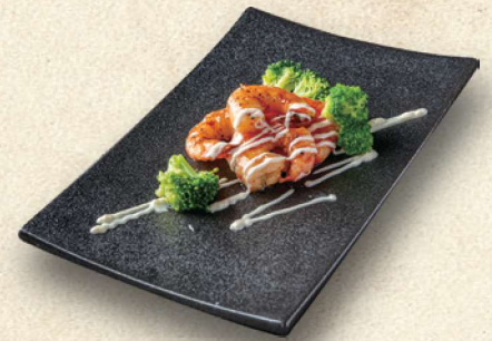
特製 海老マヨ鉄板焼 780円