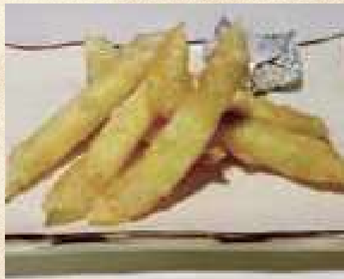
カリカリチーズフライ 580円