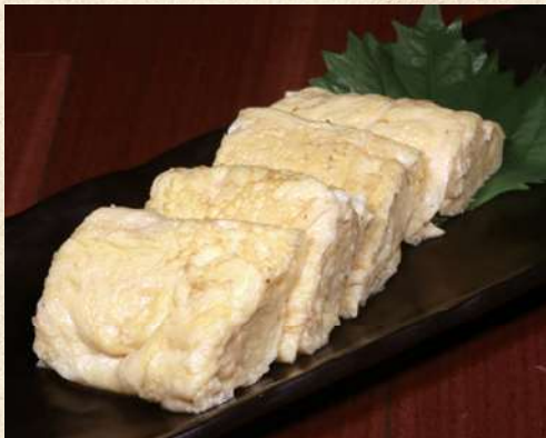
鉄板だし巻き玉子 580円