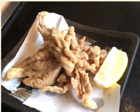
せせりから揚げ 680円