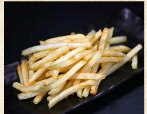
みんな大好きポテトフライ 560円