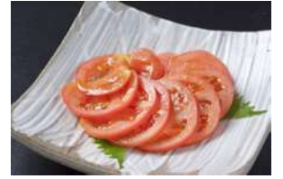
トマトスライス 480円