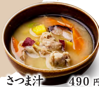
さつま汁 490 円 (税込 539 円)