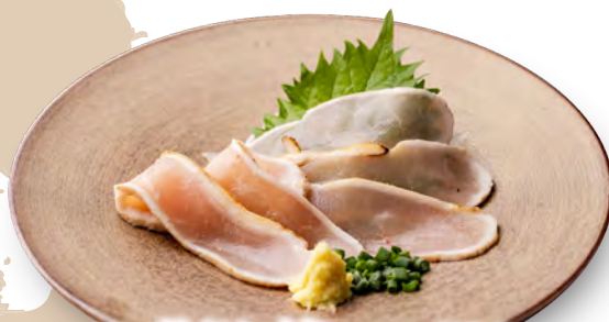
九州産 鶏むね刺し 790 円 (税込 869 円)