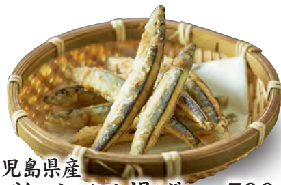
鹿児島県産 きびなごのから揚げ 790 円 (税込 869 円)