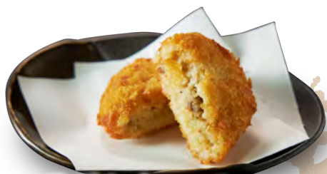
厳選和牛コロッケ

1 個 245 円 2 個 490 円 (税込 270 円) (税込 539 円)