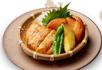
鹿児島名物 さつま揚げ 790 円 (税込 869 円)