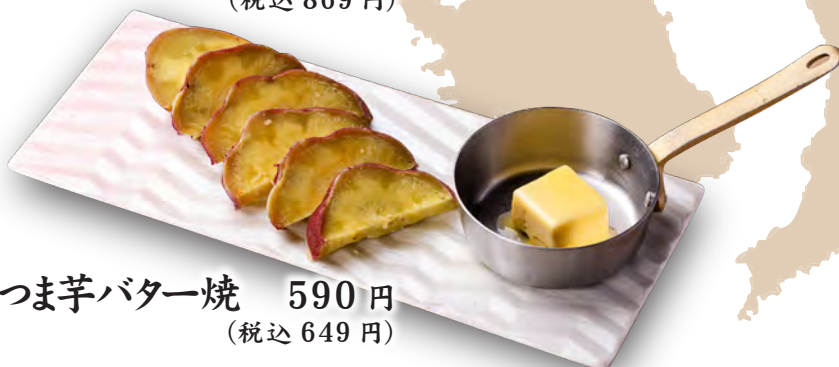
さつま芋バター焼 590 円 (税込 649 円)